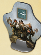
les Soldats Nains