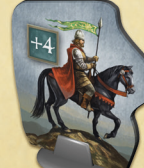
le Prince Thorald