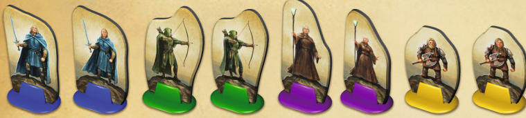
Guerrier Guerrière Archer Archère Magicien Magicienne Nain Naine