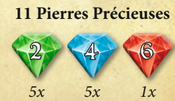
5x 5x 1x