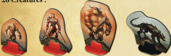
16 Gors 5 Skrals 5 Trolls 2 Wardraks