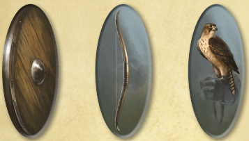
4x Bouclier 3x Arc 2x Faucon